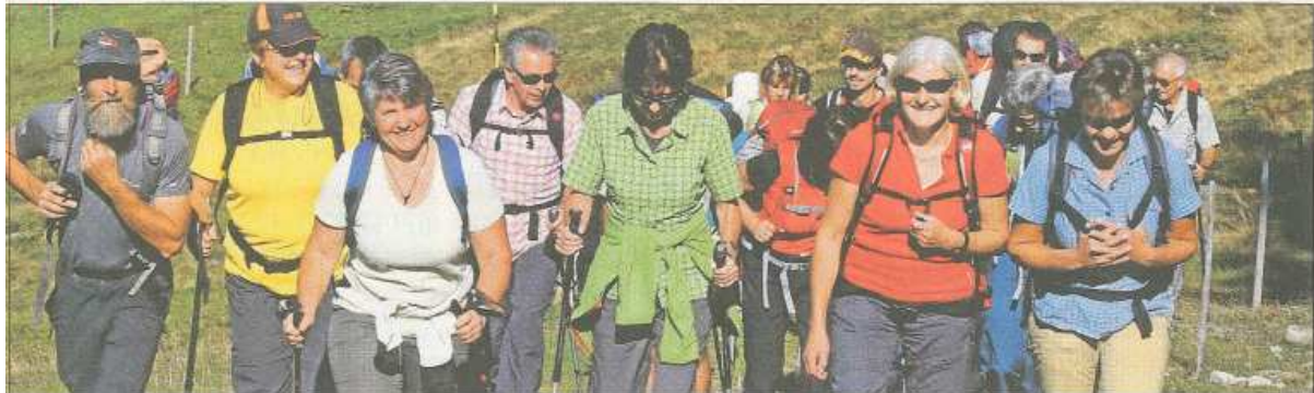
Le club de sports de neige Madrisa: En route.